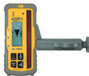
Ricevitore (laserometro) a lettura digitale HL 760