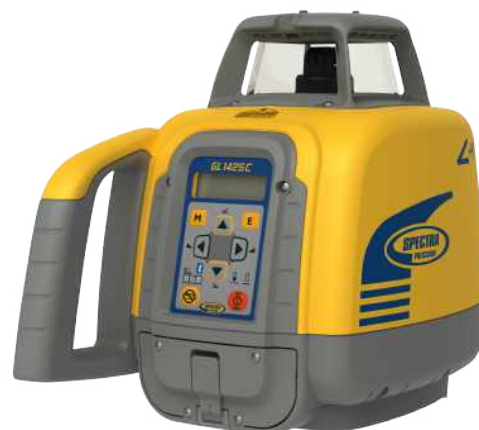
Livello Laser GL 1425 C