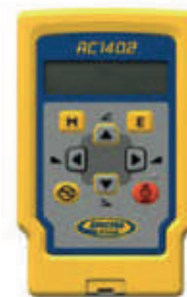
Radiocomando RC 1402